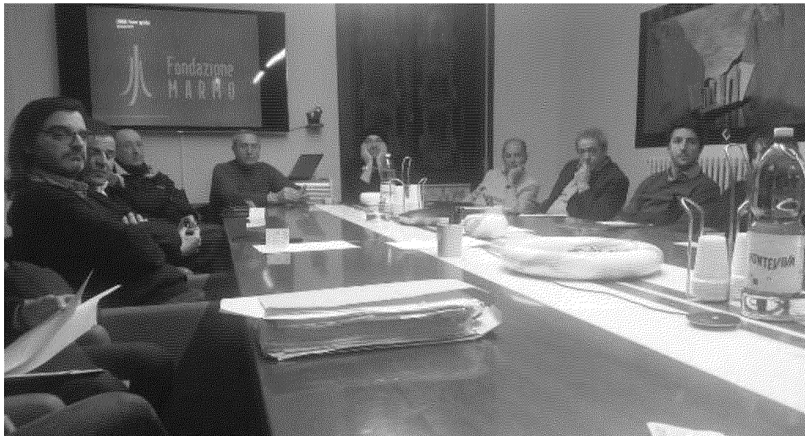
LA FIRMA La stipula della convenzione con cui Assindustria apre la Fondazione marmo